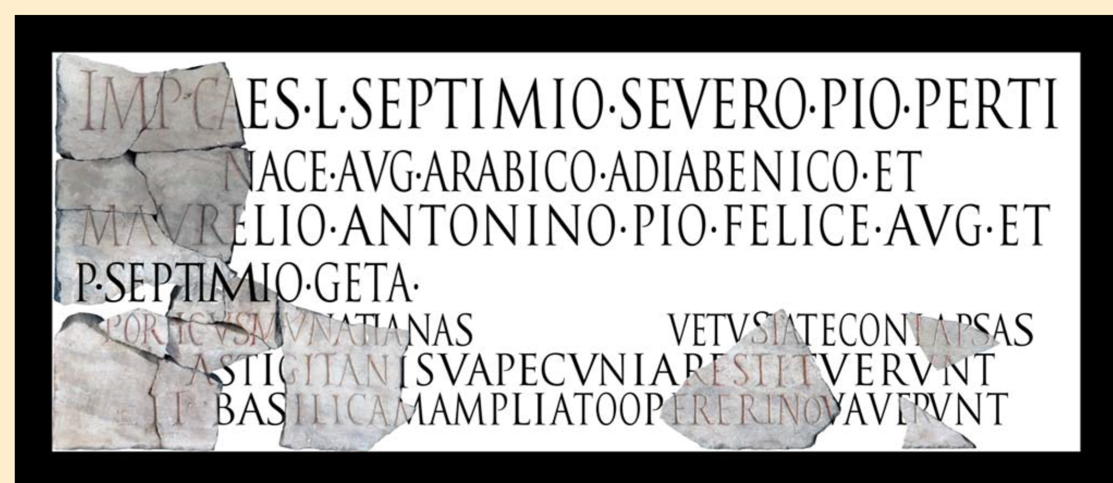
ZPE 194, 286 ( Astigi )

Epitafio del esclavo imperial Felix , dispensator arcae patrimonii en Hispalis .