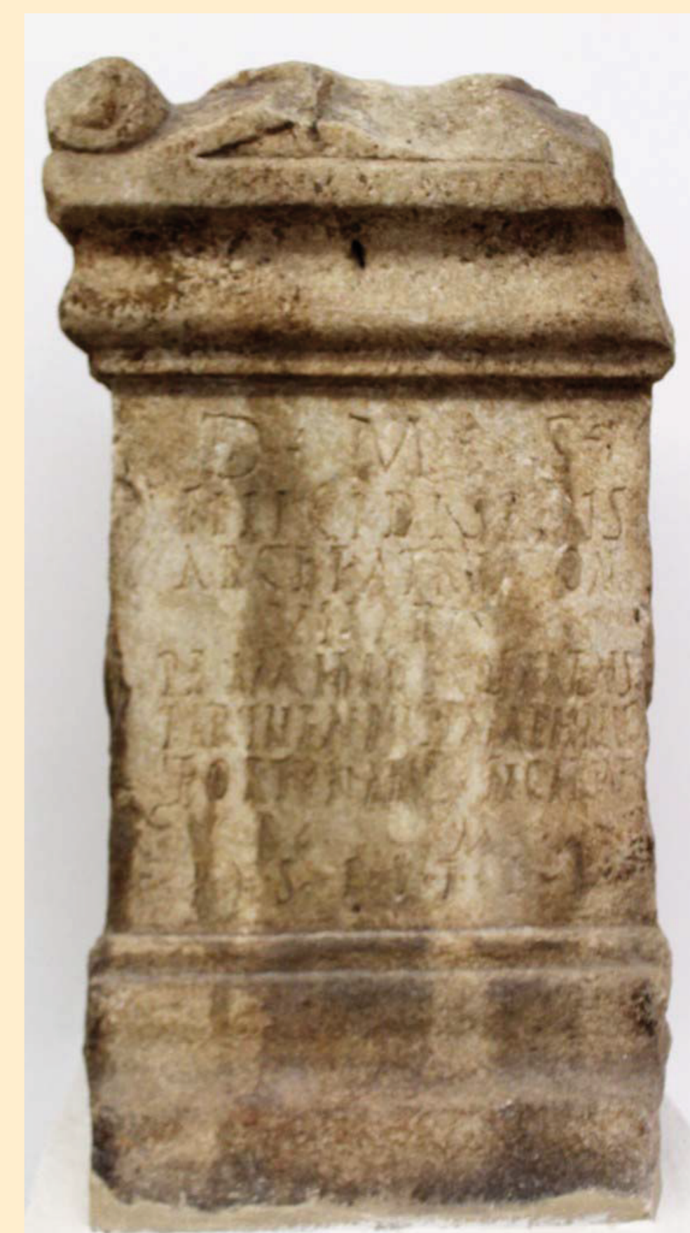
CIL II, 1198 ( Hispalis )

Evergesias ob honorem flaminatus de L. Iunius Paulinus , incluyendo juegos gladiatorios y dos representaciones teatrales